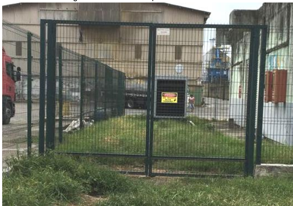
Figura 02 – Modelo de portão a ser instalado

2.4.4 Portão de correr com tela eletrosoldada, revestida com PVC ou pintura dupla de Poliéster, galvanizada a quente, resistente ao ambiente marítimo, na cor verde, dimensões: 5,00 x 2,73 m, com acessórios e fixado: para permitir o acesso às diversas edificações dentro da área portuária