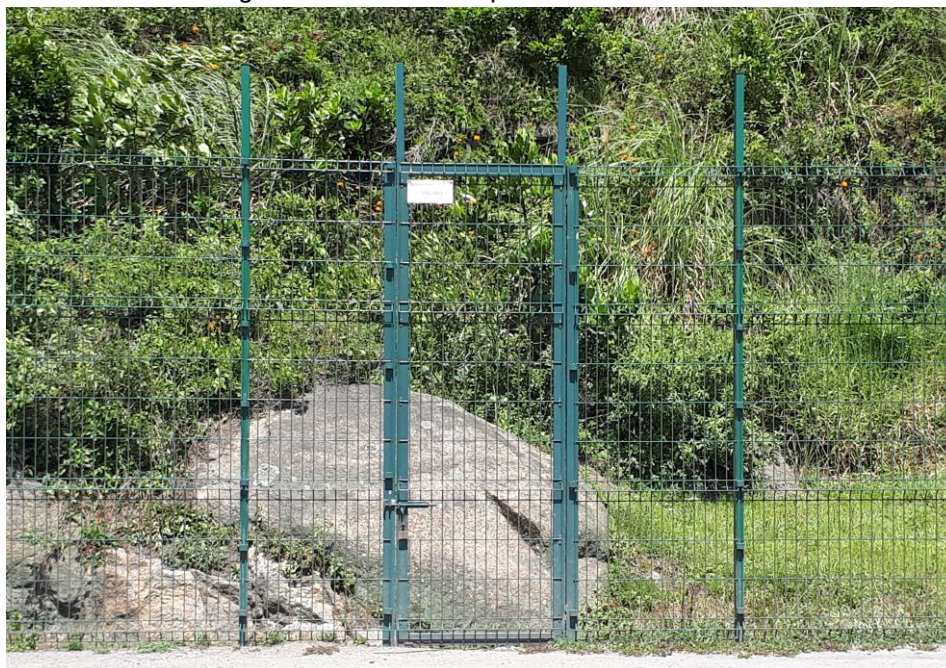
Figura 01 – Modelo de portão a ser instalado

2.4.3 Portão com tela eletrosoldada, revestida com PVC ou pintura dupla de Poliéster, galvanizada a quente, resistente ao ambiente marítimo, na cor verde, dimensões: 4,00 x 2,73 m, com acessórios e fixado: para permitir o acesso às diversas edificações dentro da área portuária estima-se que será necessário a instalação de 4,00 portões com tela eletrosoldada, de dimensões 4,00 x 2,73m, dotado de acessórios e fixado, de acordo com o modelo abaixo (Figura 02).