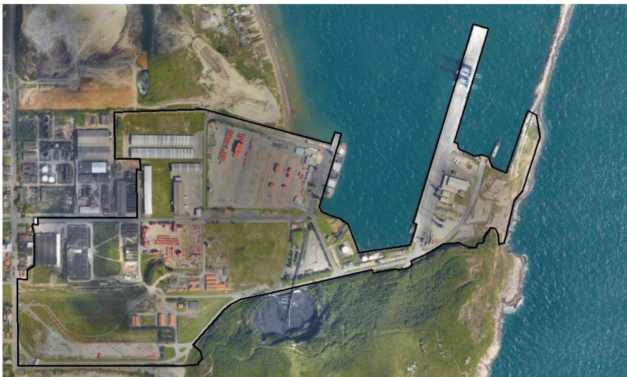
Figura 04 – Área para execução de cercamento